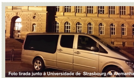
Foto tirada junto à Universidade de -Strasbourg na Alemanha