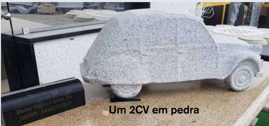
Um 2CV em pedra