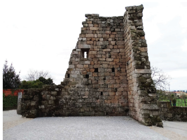
Torre de Gandufe

Aqui se encontra a antiga Torre de Gandufe, um Monumento de Interesse Municipal, cujas origens se perdem nos tempos, mas que se diz ser do Sec. XII, erigida para defesa e residência senhorial. Recuperada pela actual Junta de Freguesia, em colaboração com Câmara de Mangualde, é um património digno de uma visita.